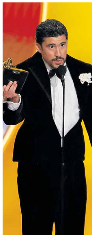
Bad Bunny en los Grammy.

ha venido envuelto en una polémica que ha adquirido unas dimensiones épicas y en la que el propio Trump ha librado una guerra de la que ha salido trasquilado. La elección de Bad Bunny se había resuelto por aclamación popular, pero el actual presidente de la Casa Blanca se empeñó en exigirle que cantara en inglés, a lo que él se negó amparándose en los términos del contrato que tenía firmado con la NFL. Como mal perdedor que es, Trump impulsó que a la actuación de nuestro hombre en la Super Bowl LX le precediera la de un grupo country, Green Day, y le sucediera la de una cantante también norteamericana, Brandy Carlile, que debía entonar el 'América The Beautiful'. El tiro le salió ayer por la culata porque los primeros son antiTrump y la cantante es lesbiana, o sea, la más indicada para dar a los «spacious skies» de ese himno un hondo significado de liber-